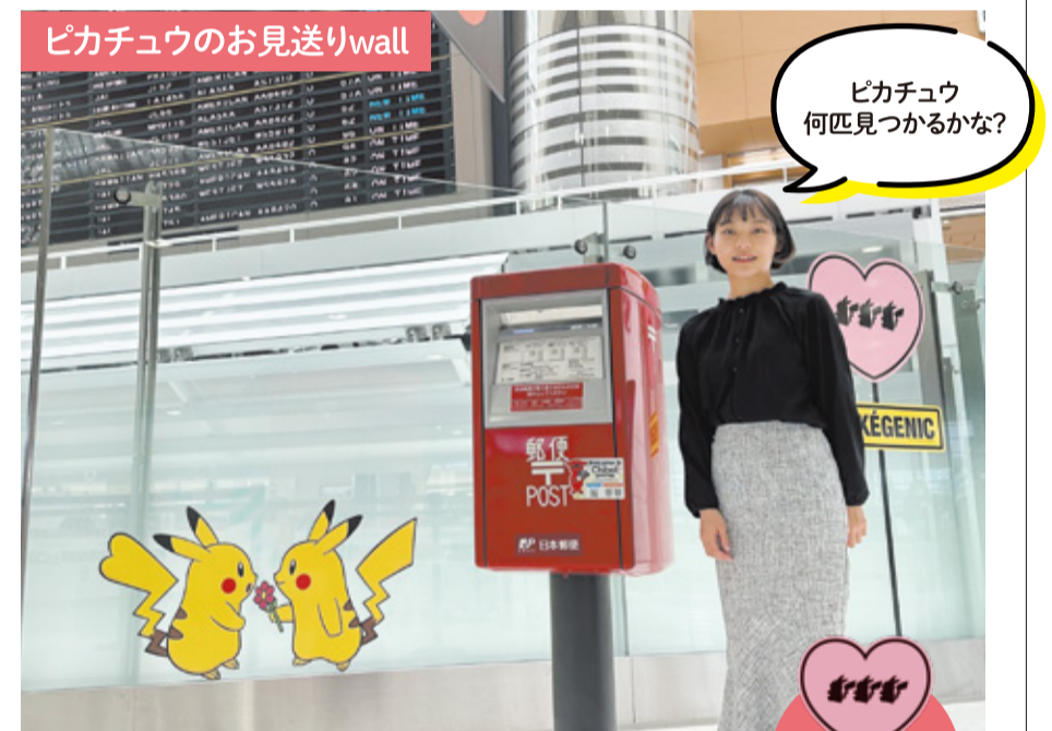
第2ターミナル出発ロビーには、たくさんのピカチュウが登場。ハートの「POKÉGENICマーク」を見つけたら、幸せを呼ぶピカチュウに会えるかもしれませんよ。

©Pokémon. ©Nintendo/Creatures Inc./GAME FREAK inc.