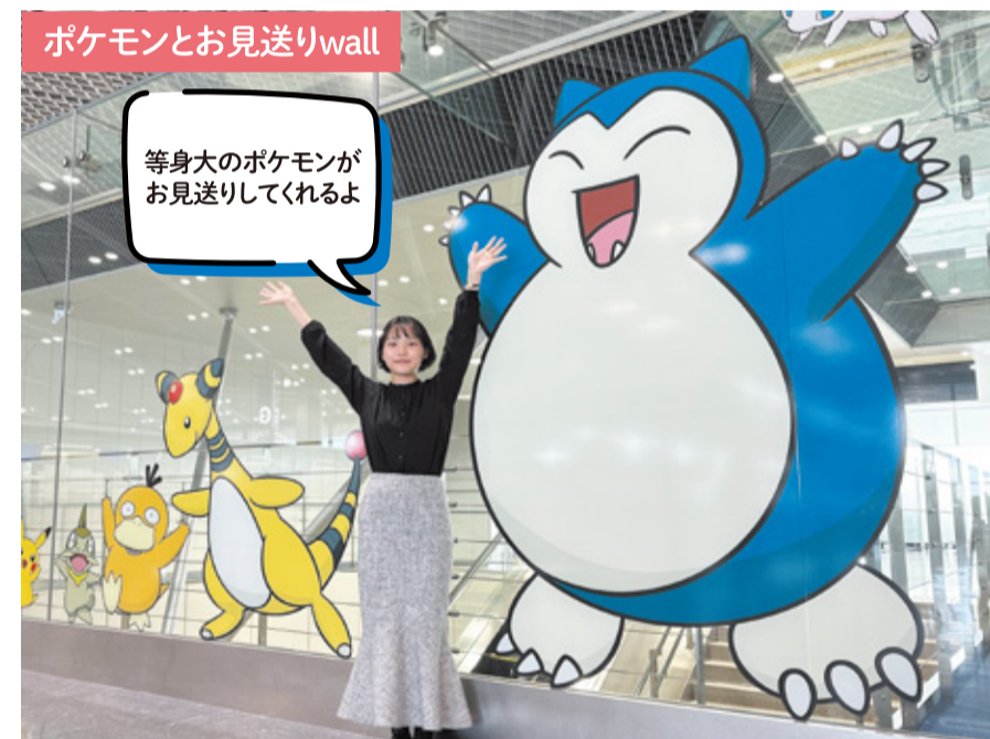
第1ターミナル出発ロビーには、「いってらっしゃい」のポーズをした等身大のポケモンがずらり。かわいいポケモンと一緒に、出発する人をお見送りしましょう!