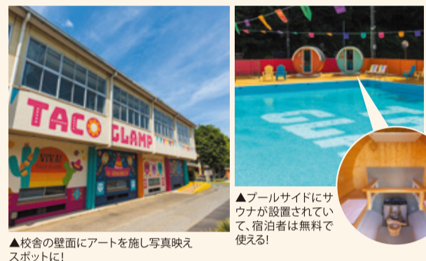
▲校舎の壁面にアートを施し写真映えスポットに!

廃校になった小学校は、地域住民にとっては思い出の場所。だからこそ、小学校の雰囲気を残すことも大切にしています。例えば、プールや体育館はほぼそのまま活用。水道管やエアコン、建物などもほぼそのまま使用できるので、宿泊するだけでサステナブルにつながっているのです。